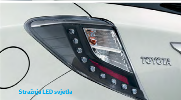
Stražnja LED svjetla