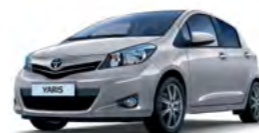
1F7 Srebrna* (Silver Metallic)