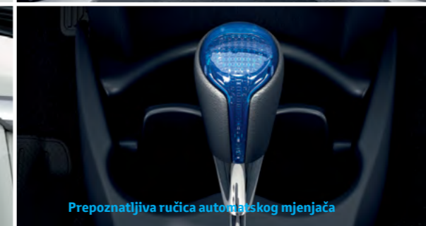
Prepoznatljiva ručica automatskog mjenjača