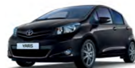
209 Crna* (Black Mica)