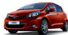
3N8 Tamno crvena* (Red Mica)