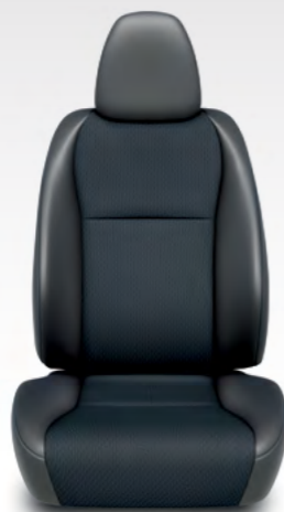
Sjedala Sport (kombinacija kože i tkanine)