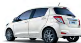
040 Bjela (Super White II)