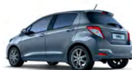
8S7 Svijetlo plava* (Light Blue Mica)