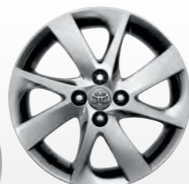
16" aluminijski naplatci SPORT