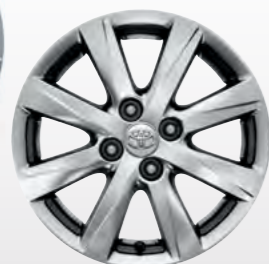
15" aluminijski naplatci SOL