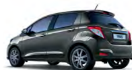
1G3 Tamno siva* (Gray Metallic)