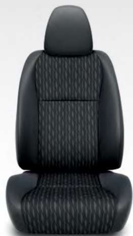
Sjedala Luna (tkanina)