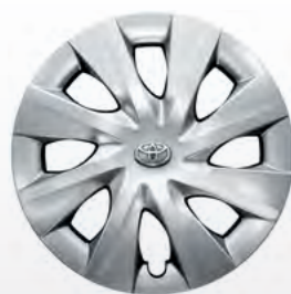
15" čelični naplatci s poklopcima kotača LUNA