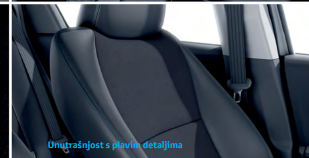
Unutrašnjost s plavim detaljima