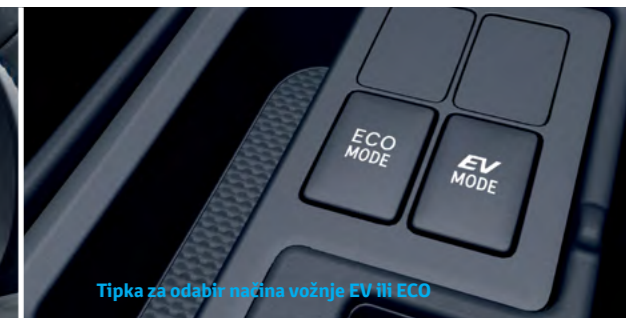
Tipka za odabir načina vožnje EV ili ECO