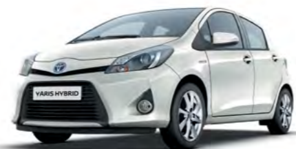
084 Bijela perla* (Glacier Pear White)