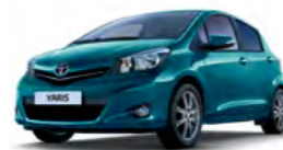
788 Tirkizna* (Turquoise Mica)