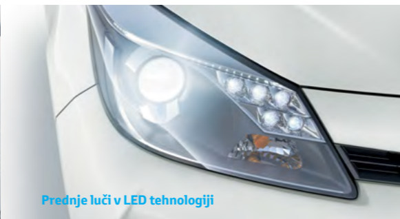
Prednje luči v LED tehnologiji