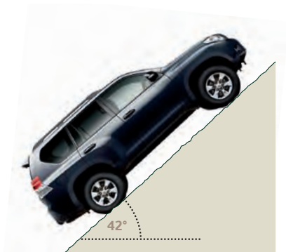
Kut uspona 42°