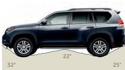
Ulazni, izlazni kut i kut od središta prema kotačima