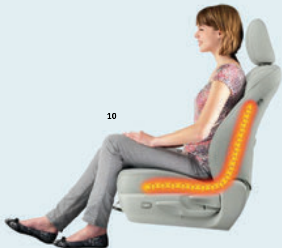
10 Ogrevan sprednji sedež Prijetna toplota za hladne dni.