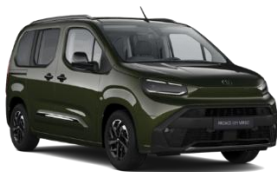
BACKPACKER CHAKI (KNQ) METALLIC 1.400 KM