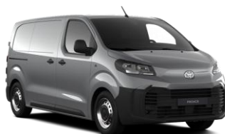
GREY CLOUD (KCA) METALLIC 1.400 KM