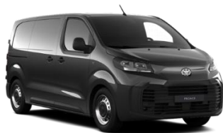
MAJESTIC GREY (KKJ) METALLIC 1.400 KM