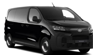
ABSOLUTE BLACK (KTV) METALLIC 1.400 KM