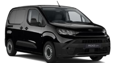
ABSOLUTE BLACK (KTV) METALLIC 1.400 KM