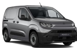
GREY CLOUD (KCA) METALLIC 1.400 KM