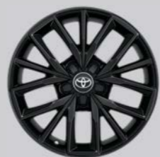
Crni naplatak od lake legure, 17" (5 trostrukih krakova) Opcija za sve razine opreme