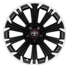
Naplatci od lake legure, 17", strojno obrađeni (10 krakova) Standardno za opremu GR SPORT