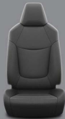
Crna tkanina Standardno za opremu Terra