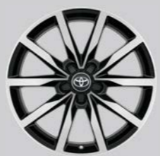
Naplatak od lake legure, 18", crni, strojno obrađeni (5 dvostrukih krakova) Opcija za sve razine opreme