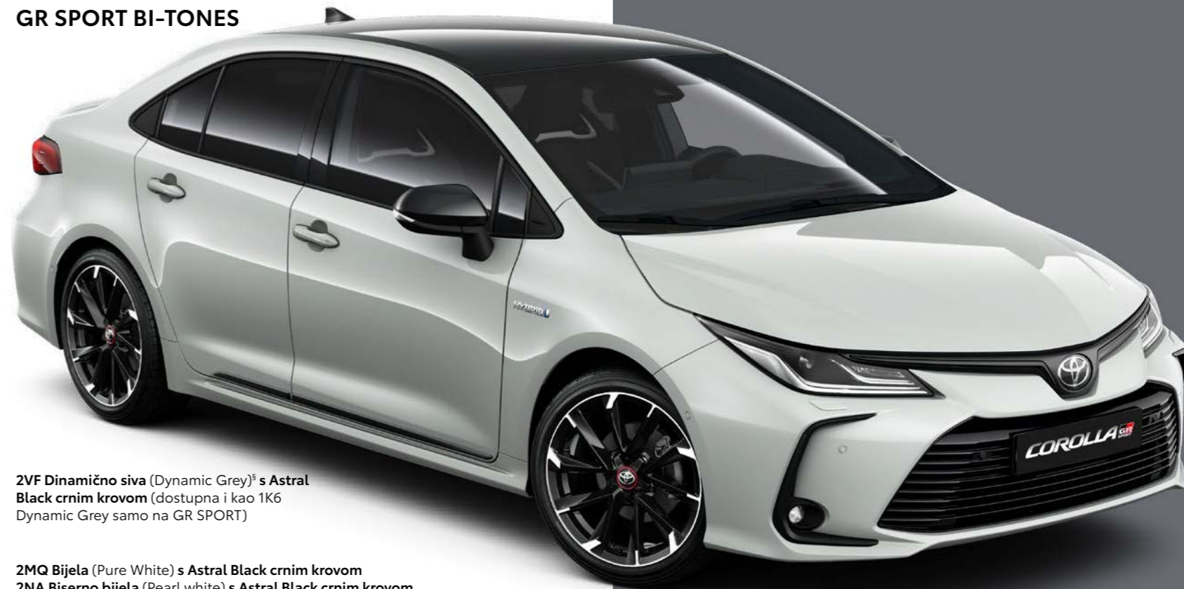
2VF Dinamično siva (Dynamic Grey) § s Astral Black crnim krovom (dostupna i kao 1K6 Dynamic Grey samo na GR SPORT)