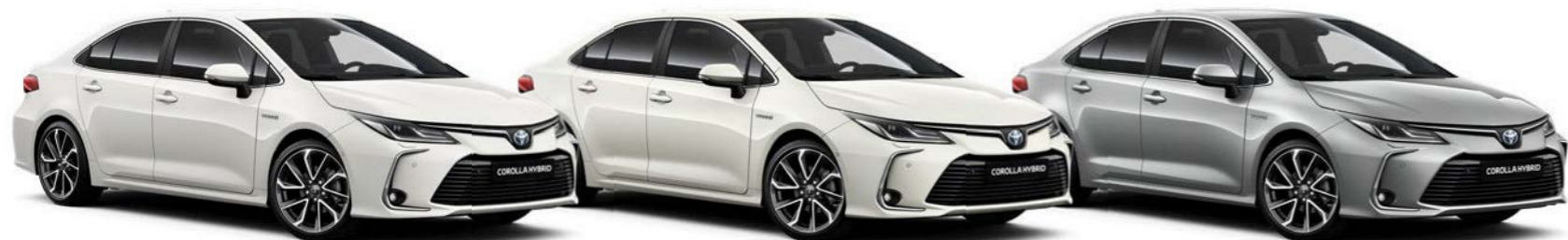
040 Bijela / Pure White