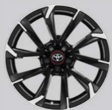
18" bi-tone crni strojno obrađeni naplatci od lake legure (5 dvostrukih krakova) § Opcija za opremu GR SPORT