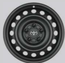
Čelični naplatci od 16" s poklopcima točkova Opcija za sve razine opreme