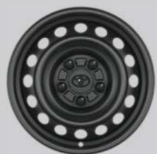
Čelični naplatci od 15" s poklopcima točkova Opcija za sve razine opreme