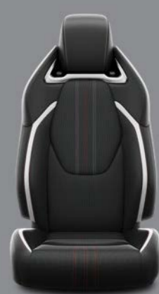
Siva tkanina s crnim podupiračima nalikom na kožu i satenskim ukrasima Standardno za opremu GR SPORT