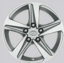
Srebrni naplatci od lake legure, 16" (5 krakova) Opcija za sve razine opreme