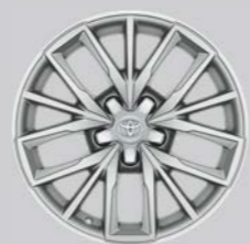
Srebrni naplatci od lake legure, 17" (5 trostrukih krakova) Opcija za sve razine opreme