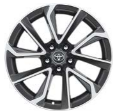
Sivi naplatci u dvije nijanse sive, 18", crni, strojno obrađeni (5 dvostrukih krakova) § Standardno za opremu Executive