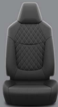
Crna tkanina s podstavljenim umetcima Standardno za opremu Luna i Sol