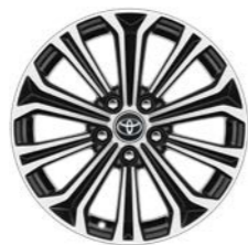
Crni naplatci u dvije nijanse crne, 17", strojno obrađeni (10 krakova)* Standardno za opremu Sol