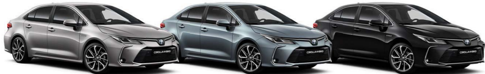
1K0 Metalno siva / Metal Stream*