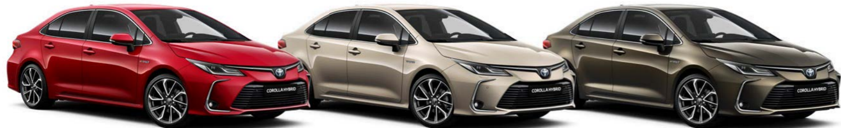
3U5 Crvena / Flame Red §