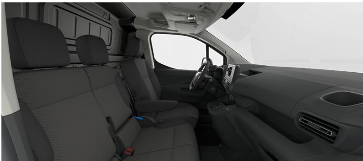
Presvlake sjedala – tamnosiva tkanina