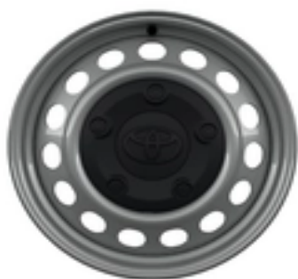
(15") čelični naplatci (16") čelični naplatci