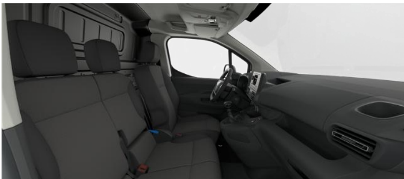
Presvlake sjedala – tamnosiva tkanina