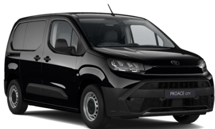
CRNA BLACK (KTV) METALIK