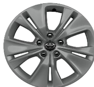
17" Aluminijski naplatci