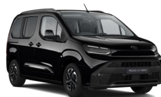
CRNA ABSOLUTE BLACK (KTV) METALIC