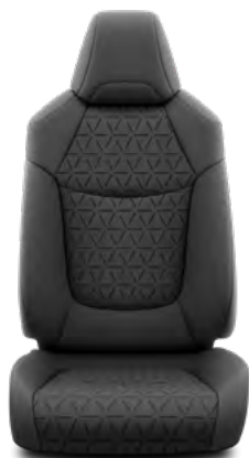
Crna tkanina Standardno za opremu Limited i Elegant