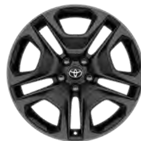
Tamno sivi naplatak od lake legure, 19" (5 dvostrukih krakova) Standardno za opremu Adventure