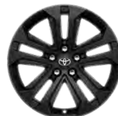
Crni naplatak od lake legure, 18" (5 dvostrukih krakova) Opcija na svim razinama opreme