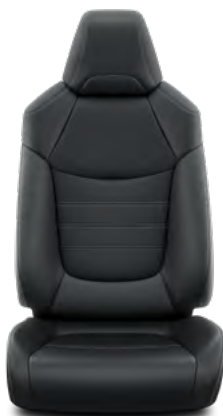
Crna koža Standardno za opremu Premium