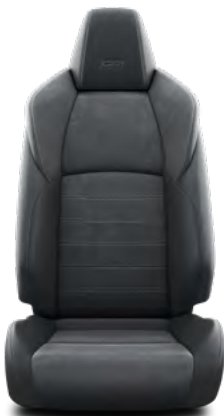
GR SPORT crna sintetička koža u kombinaciji s brušenom kožom sa srebrnim prošivima Standardno za opremu GR SPORT