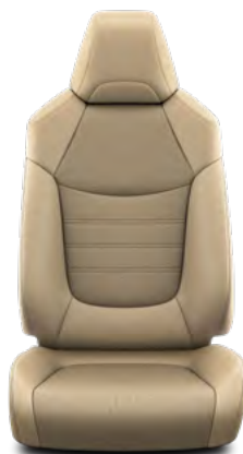
Bež koža Standardno za opremu Premium