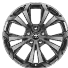
Naplatak od lake legure, 18" (5 dvostrukih krakova) Opcija na Elegant