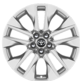
Srebrni naplatak od lake legure, 19" (5 dvostrukih krakova) Standardno za opremu Premium