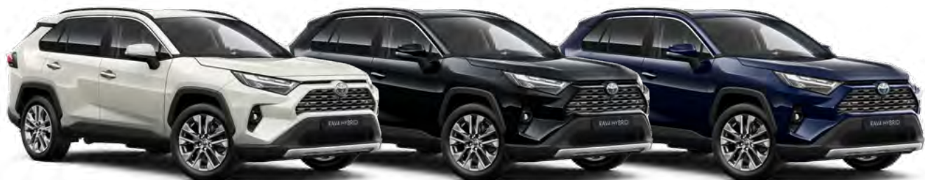
RAV4 mono izbor boja