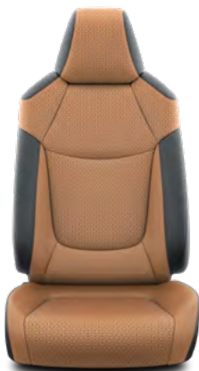
Koža, crna i smeđe boje sedla* Opcija za opremu Limited i Elegant