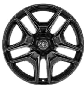
Sjajni crni naplatak od lake legure, 19" (5 dvostrukih krakova) Standardno za opremu GR SPORT