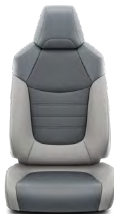
Svijetlosiva koža Standardno za opremu Premium