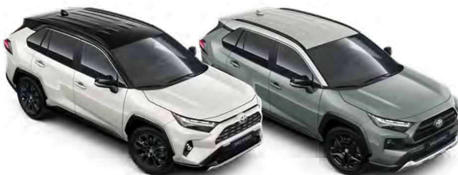
RAV4 bi-tone izbor boja