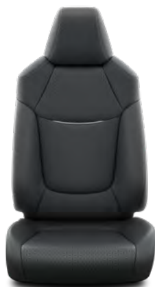
Crna koža sa sivom ukrasnom trakom i šavovima Opcija za opremu Limited i Elegant