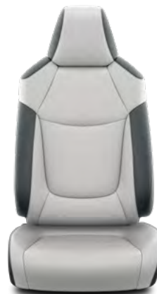
Siva i crna koža* Opcija za opremu Limited i Elegant