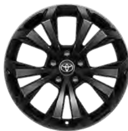
Crni naplatak od lake legure, 18" (5 dvostrukih krakova) Standardno za opremu Style