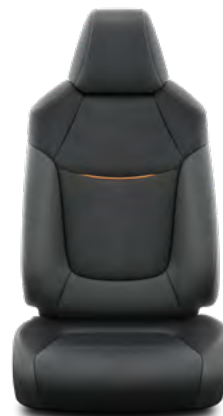
Crna Alcantara® i koža s ukrasnom trakom i šavovima smeđe boje sedla* Opcija za opremu Limited i Elegant