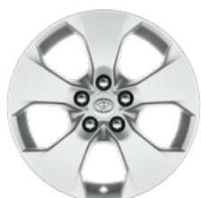
Srebrni naplatak od lake legure, 17" (5 krakova) Opcija za sve razine opreme