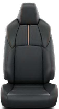
Crna koža sa narančastom ukrasnom trakom i šavovima Standardno za opremu Adventure