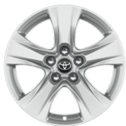
Srebrni naplatak od lake legure, 17" (5 krakova) Standardno za opremu Limited