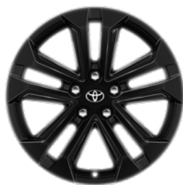
Crni naplatak od lake legure, 18" (5 dvostrukih krakova) Standardno za opremu Elegant i opcija na svim ostalima razinama opreme