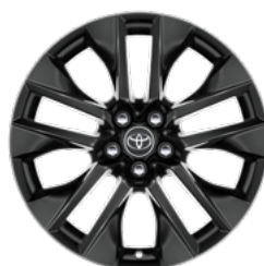
Crni naplatak od lake legure, 19" (5 dvostrukih krakova) Opcija na Style i Premium