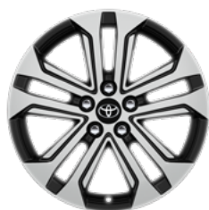
Naplatak od lake legure, strojno obrađen, 18" (5 dvostrukih krakova) Opcija na svim razinama opreme