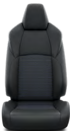
Crna presvlaka sjedala od imitacije kože s plavim šavovima Standardno za opremu Style