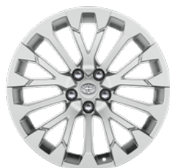
Srebrni naplatak od lake legure, 19" (15 krakova) Opcija za sve razine opreme