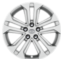
Srebrni naplatak od lake legure, 18" (5 dvostrukih krakova) Opcija na svim razinama opreme