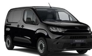
ABSOLUTE BLACK (KTV) METALLIC 1.400 KM