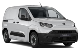
ICE WHITE (EPR) METALLIC 0 KM