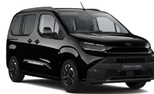
CRNA (KTV) METALIK 700€