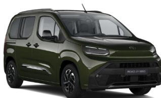
ZELENA (KNQ) METALIK 700€