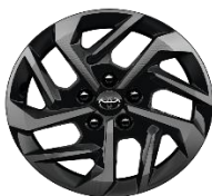
16" mašinski obrađeni - aluminijumski