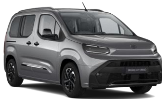
SREBRNA (KCA) METALIK 700€