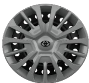
16" crni sa ratkapom