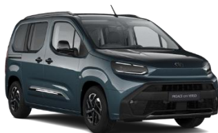
PLAVA (KJW) METALIK 700€