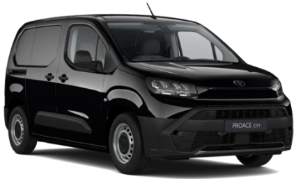
CRNA (KTV) METALIK 700€