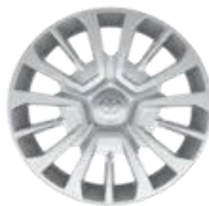
16" – čelični točkovi sa ratkapnom