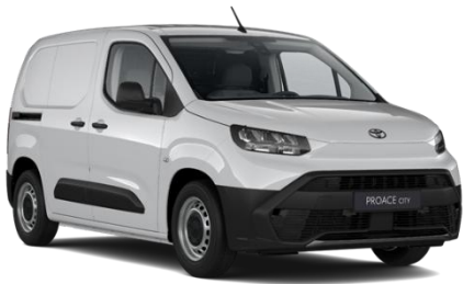
BELA (EPR) NEMETALIK 0