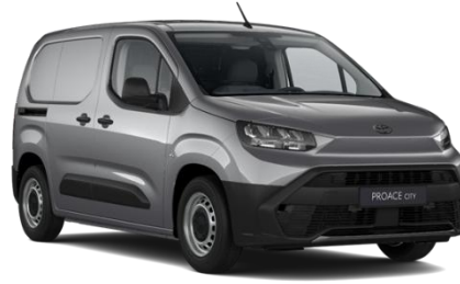
SREBRNA (KCA) METALIK 700€