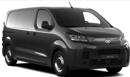
TAMNO SIVA (KKJ) METALIK 700€