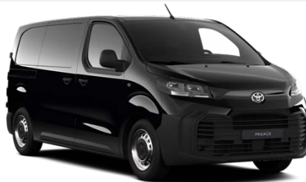
CRNA (KTV) METALIK 700€