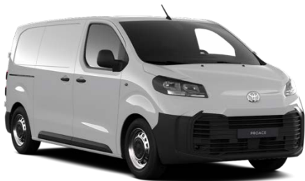
BELA (EPR) NEMETALIK 0€