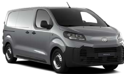
SREBRNA (KCA) METALIK 700€