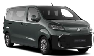
ZELENA GREEN VELVET (EDU) (ni na voljo na nivoju opreme Combi & Shuttle brez opcije DA/DB) KOVINSKA 550 €