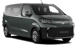
ZELENA GREEN VELVET (EDU) (samo na nivoju opreme Family) KOVINSKA 550 €