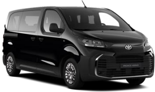
ČRNA ABSOLUTE BLACK (KTV) KOVINSKA 550 €