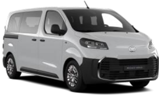
BELA ICE WHITE (EPR) PASTELNA 0 €