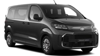
SIVA MAJESTIC GREY (KKJ) KOVINSKA 550 €