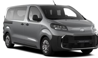
SIVA GREY CLOUD (KCA) KOVINSKA 550 €