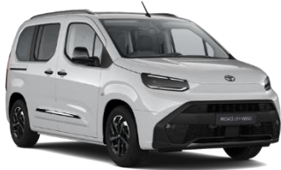
BELA ICY WHITE (EPR) PASTELNA