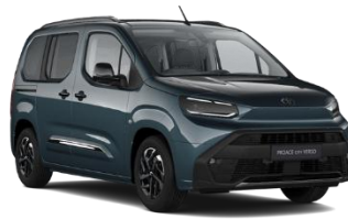
MODRA AQUAMARINE (KJW) KOVINSKA