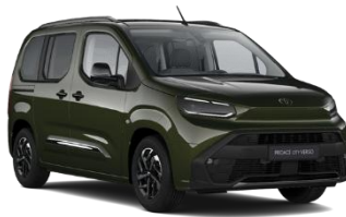
ZELENA BACKPACKER CHAKI (KNQ) KOVINSKA