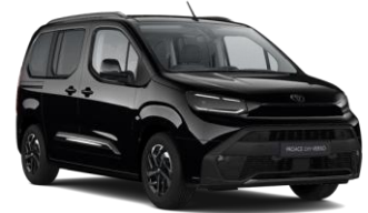
ČRNA ABSOLUTE BLACK (KTV) KOVINSKA