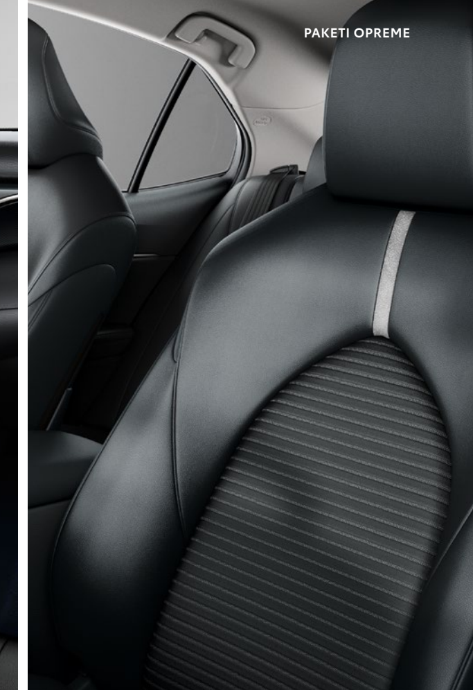
SEDEŽI IZ ČRNEGA UMETNEGA USNJA Športni sedeži omogočajo udobje in ustvarjajo vtis usnjenega oblazinjenja.