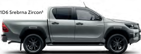
1D6 Srebrna Zircon §