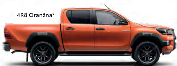
4R8 Oranžna §