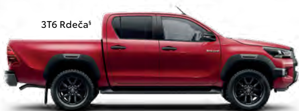
3T6 Rdeča §