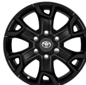
1. 43,2 cm (17-palčna) jeklena platišča Standardno pri paketih opreme Country in Comfort.