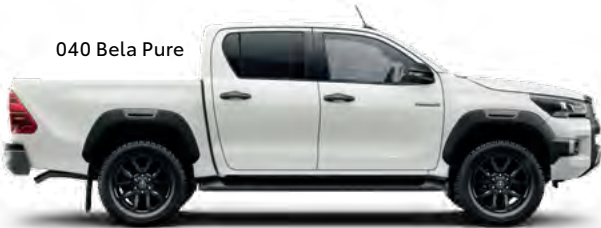
040 Bela Pure