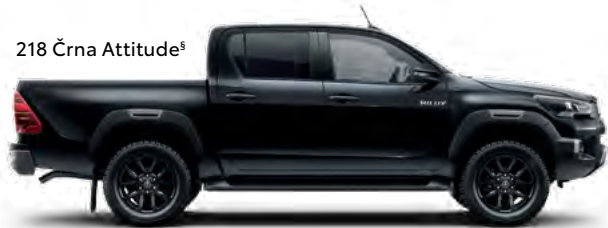
218 Črna Attitude §