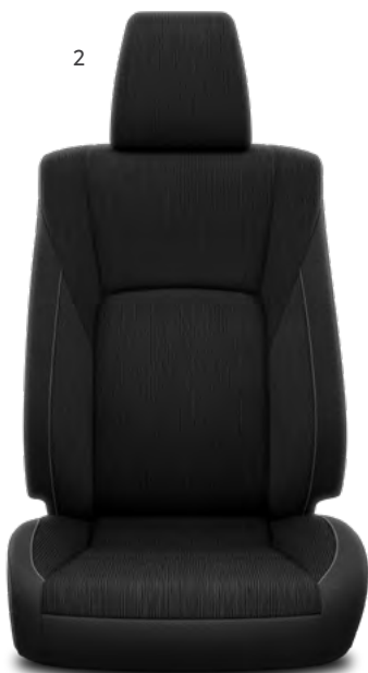
2. Črna tkanina z vertikalnim vzorcem Standardno pri paketih opreme City Plus.