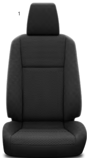
1. Črna tkanina z ovalnim vzorcem Standardno pri paketih opreme Country in Comfort.