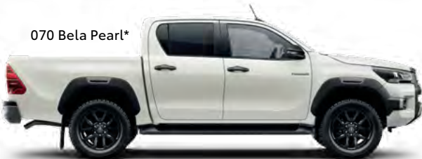
070 Bela Pearl*