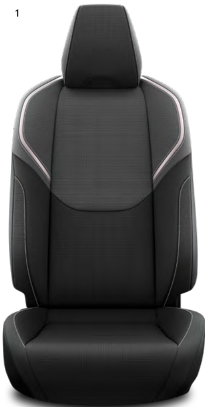
1. Tkanina v črni barvi Standardno pri paketih opreme Elegant in Executive.