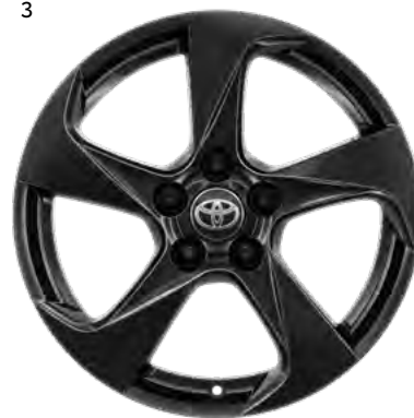
3. 43,18-centimetrska (17-palčna) 5-kraka lita platišča Opcijsko pri vseh paketih opreme.