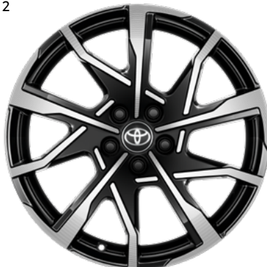
2. 48,26-centimetrska (19-palčna) 10-kraka strojno obdelana lita platišča v črni barvi Standardno pri paketih opreme Executive in Premium.