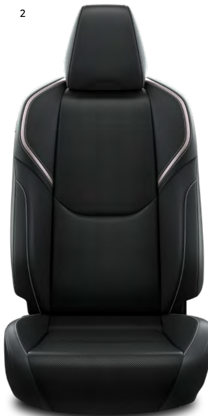
2. Vegansko usnje v črni barvi Standardno pri paketu opreme Premium.